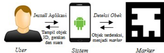
Gambar 1. Deskripsi Umum Sistem

Aplikasi augmented reality sholat shubuh ini adalah sebuah aplikasi berbasis mobile yang terintegrasi dengan sistem operasi android . Aplikasi ini didesain khusus untuk satu orang saja ( single user ). User dapat menentukan sendiri objek atau penanda yang akan dijadikan marker pada saat menjalankan aplikasi. Deskripsi umum sistem dapat dilihat pada Gambar 1.