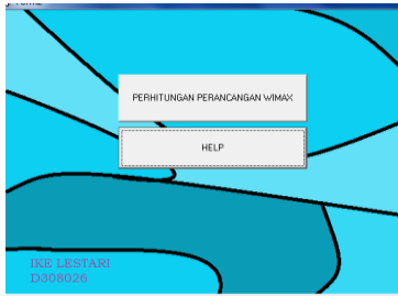
Gambar 2. Tampilan Form Utama Perancangan WiMAX

digunakan untuk menghitung tahapan perancangan jaringan dan 'Help'.